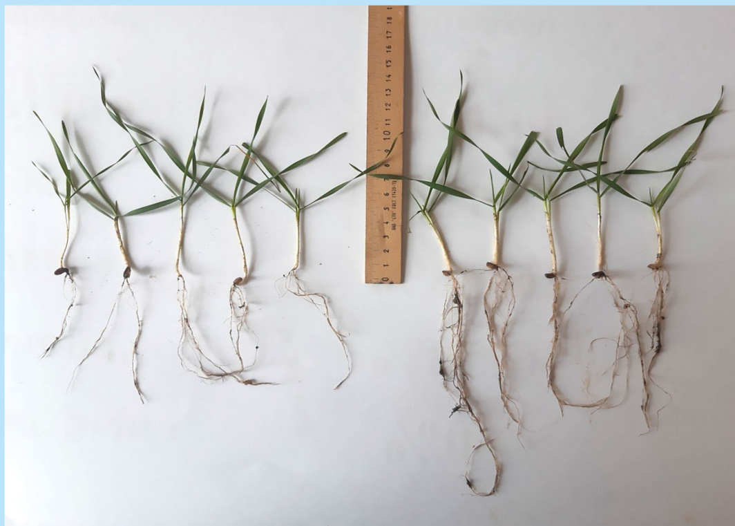
Рис. 1. Развитие корневой системы озимой пшеницы после обработки семян ГКС + 1 БЗ.