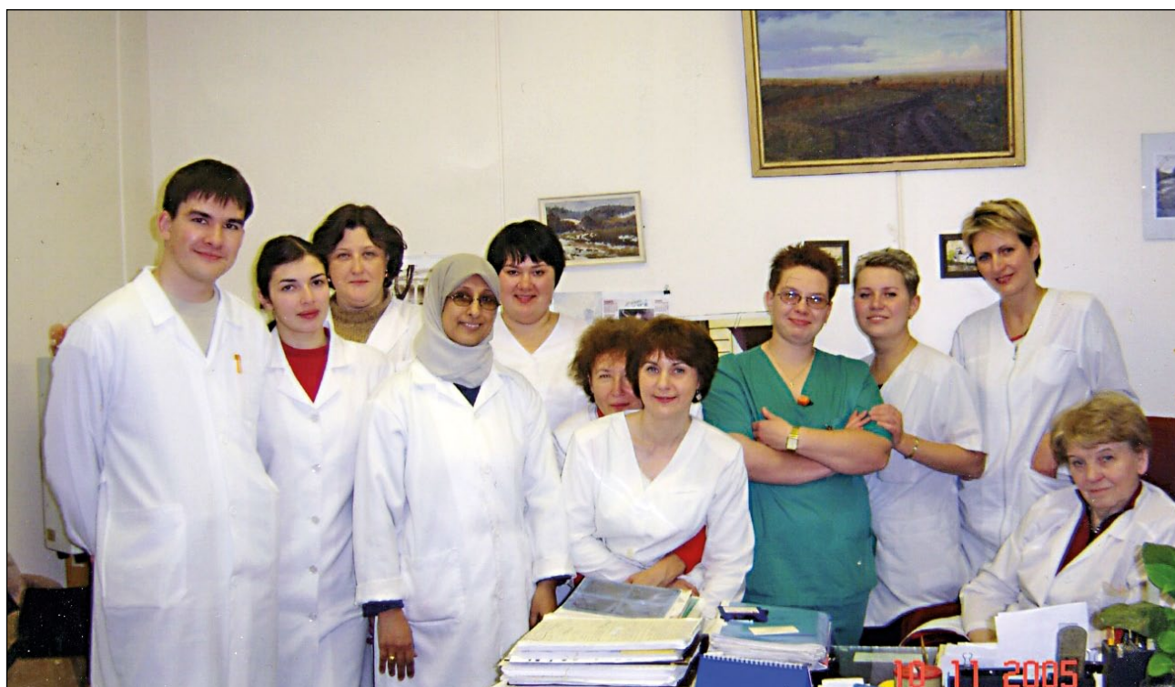
Отдел рентгенологии НИИ скорой помощи имени Н.В. Склифосовского (2004–2005 гг.).