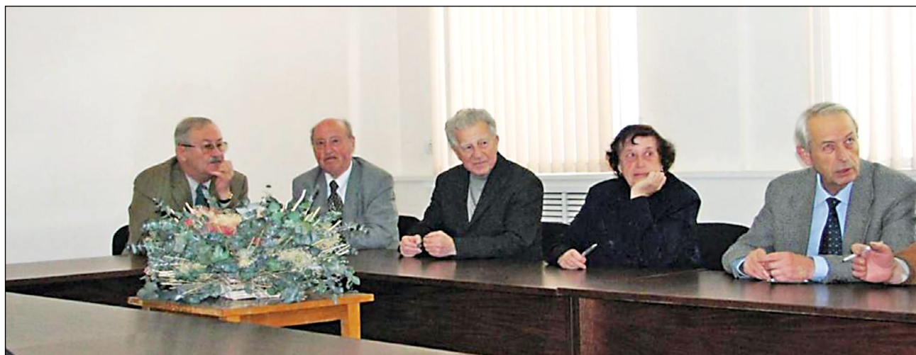
Заседание профильной аттестационной комиссии.