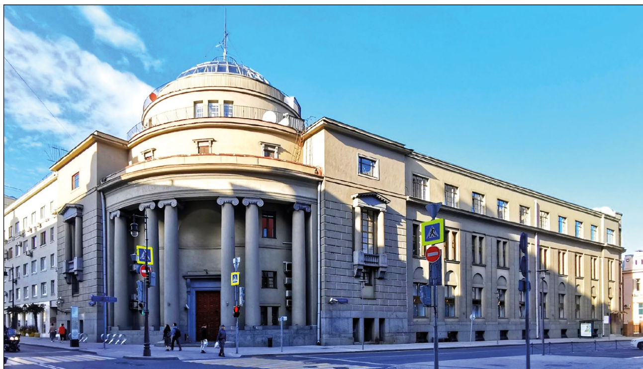
Научно-практический клинический центр диагностики и телемедицинских технологий Департамента здравоохранения города Москвы.